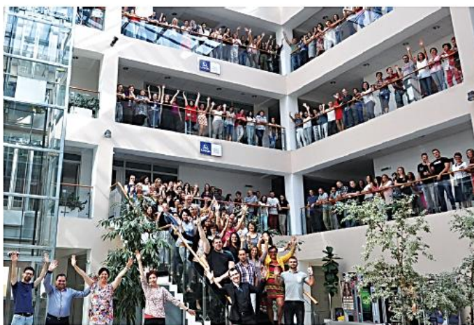
Dosaiahnutie hranice 500 zamestnancov.

Firma sa na slovenskom a najmä nitrianskom trhu práce stihla etablovať ako významný regionálny zamestnávateľ a v septembri prekročila hranicu 500 zamestnancov s aktuálnym