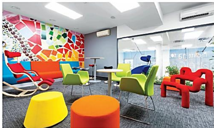
Moderne zariadená kreatívna miestnosť, tzv. „DENKRAUM“.