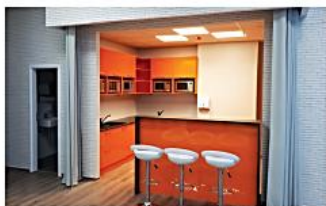
Oranžová kuchynka má povzbudiť chuť do jedla.

oblasti, v ktorej spoločnosť plánuje v najbližších rokoch aj naďalej expandovať. UNIQA GSC predstavuje servisné centrum viedenskej matky. Hlavnou úlohou je správa poisťných zmlúv a likvidácia poisťných udalostí výlučne pre rakúskych klientov UNIQA Rakúsko. Neoddeliteľnou súčasťou spoločnosti je i softvérový úsek, ktorý sa zaoberá správou informačného systému a aplikácií pre poisťovne z koncernu UNIQA.