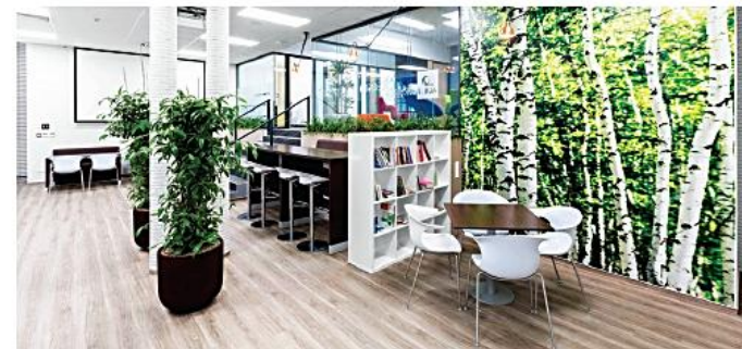
Pohľad do novej kafetérie v bývalých priestoroch Tatra banky na Palárikovej ulici.

počtom 529. Práve s nárastom nových pracovníkov sú spojené ďalšie štrukturálne ako i organizačné zmeny v spoločnosti. Stavajú sa nová budova pre ďalších 200 nových pracovníkov, ktorá by