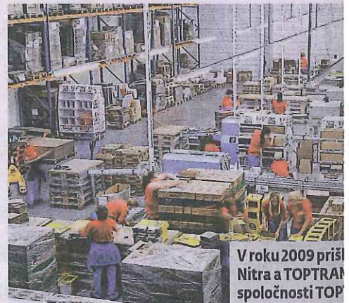
V roku 2009 prišli Nitra a TOPTRAN spoločnosti TOP

V priebehu rokov TP Nitra mal možnosť ponúknuť svoje služby takým firmám, ako sú Beiersdorf (Nivea), Johnson & Johnson, SC Johnson, Colgate