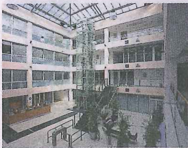
InsData sídli v moderných priestoroch v centre mesta.

Spoločnosť InsData, s.r.o., sa aj vďaka úseku Cross Border Service stala lukratívnym zamestnávateľom, ktorý v centre mesta poskytuje zaujímavú prácu a hodnotné sociálne zázemie pre svojich pracovníkov. Podmienkou zamestnania v CBS je dobrá znalosť nemeckého jazyka, ktorá je pri spolupráci s Rakúskom nevyhnutná. Spoločnosť investuje finančné prostriedky do ďalšieho odborného i jazykového vzdelávania pracovníkov a snaží sa vytvoriť im príjemné pracovné prostredie, lebo je presvedčená, že len motivovaní pracovníci sú schopní podávať tie najlepšie výkony. (TS)